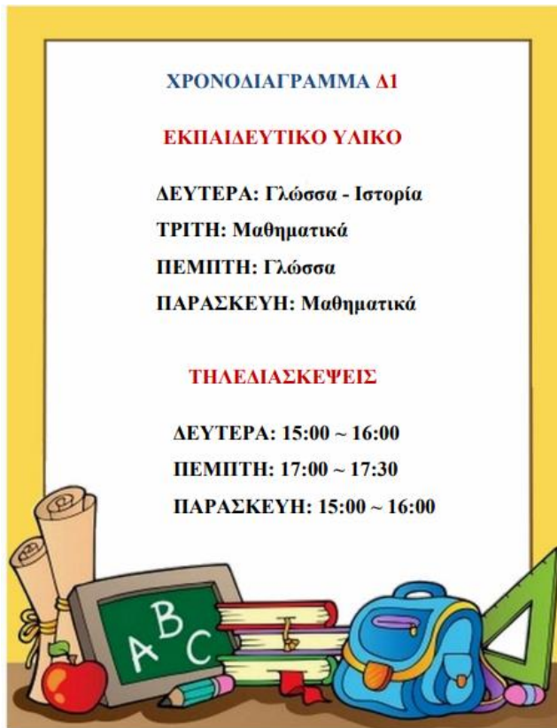
Εικόνα 3 Παράδειγμα προγράμματος σύγχρονης και ασύγχρονης εκπαίδευσης

Η διαχείριση του χρόνου στο πλαίσιο της εξ αποστάσεως σχολικής εκπαίδευσης είναι ιδιαίτερα σημαντική και έχει πολλές διαστάσεις.