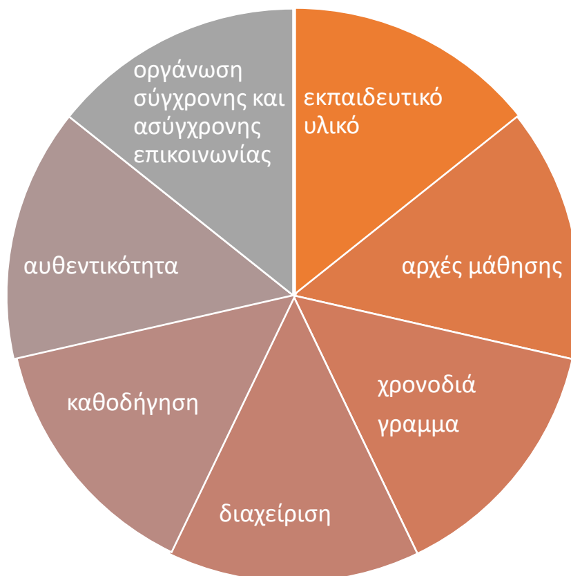
Εικόνα 2: Μερικά από τα βασικά στοιχεία του εκπαιδευτικού σχεδιασμού στην εξ αποστάσεως εκπαίδευση

Στην εξ αποστάσεως εκπαίδευση είναι ιδιαίτερα σημαντικό και απαραίτητο να ληφθούν υπόψη πολλές παράμετροι για την οργάνωση ενός αποτελεσματικού εκπαιδευτικού προγράμματος (Εικόνα 1).